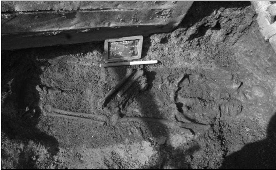
En af gravene i Svaldergade.

mange brande der har hærgnet byen efter reformationen. Ældre undersøgelser foretaget af Nationalmuseet og Slangerup Lokalhistoriske Forening har dog vist at der på de grunde der støder op til Kirketorvet findes bevarede kulturlag, som går helt tilbage til byens ældste faser karakteriseret ved den såkaldte Østersøkeramik