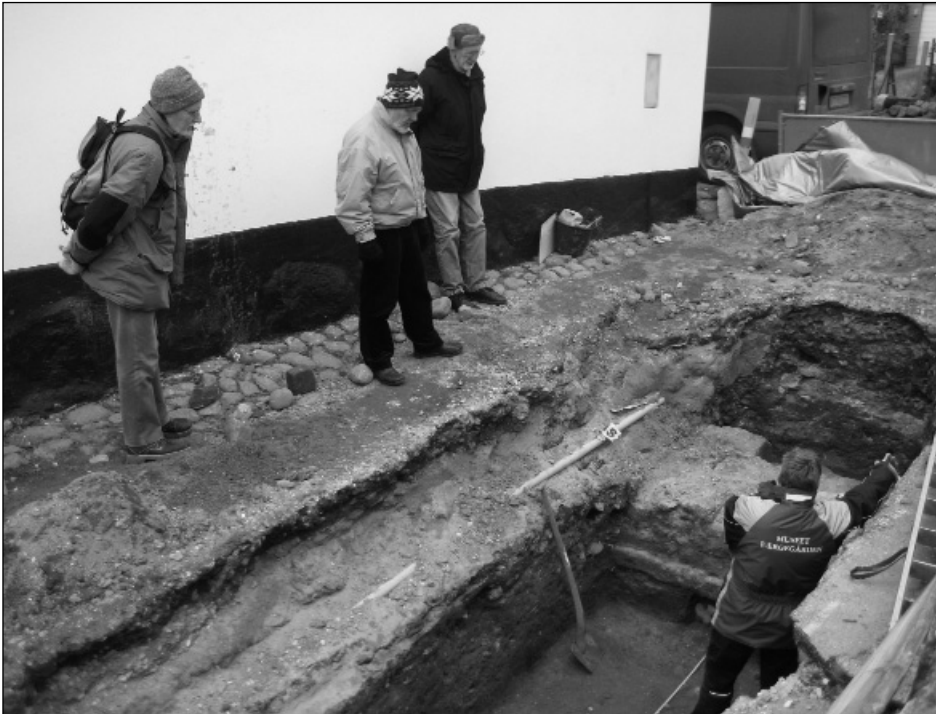
Medlemmer af Lokalhistorisk Forening ser på det sjældne syn, at fundamentet af Erik Ejegods frådstenskirke fra begyndelsen af 1100-tallet kommer frem i dagslyset.

det trace, der graves mange steder kommer ud i områder, der ikke tidligere har været berørt af de moderne nedgravninger.